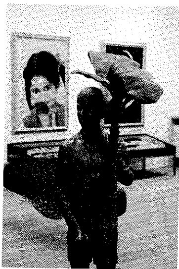
En primer término, una obra de Jitish Kallat, en el stand de Bodhi Art Gallery.