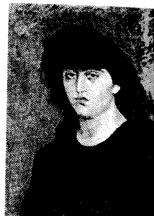
Pablo Picasso, "Retrato de Suzanne Bloch", 1904.

El sábado 26 fue programada una noche blanca , abriéndose al público tanto galerías como centros y museos, actividad complementada con un espectáculo de fuegos artificiales en la Piazza Maggiore. ■