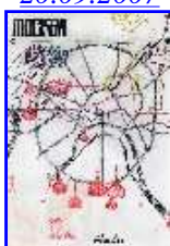
• just in time 23.05.2007