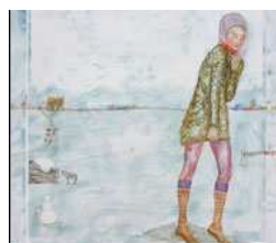
Veronica Smirnoff, tempera all'uovo su tavola in legno